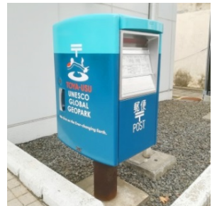
郵便ポストラッピング

この一環で、6月21日(月)、郵便局からジオパークの4つのまちの特産品をデザインした「洞爺湖有珠山ジオパーク 大地の恵み フレーム切手」が発売されました！