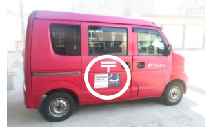
ステッカーの貼付け (白丸部分)