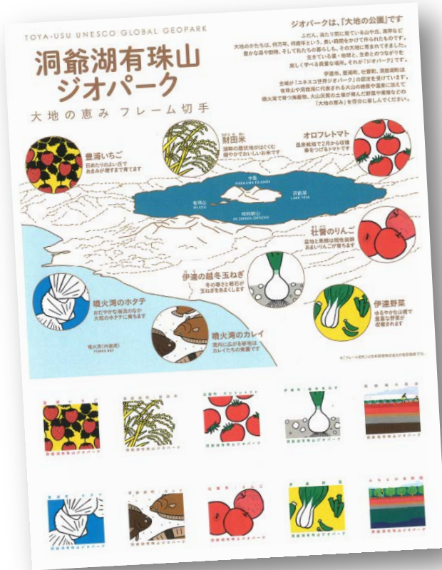
切手シートのイメージ

新型コロナウイルス感染症の影響で、親戚や友人に、会いに行けない状況が続いています。スマートフォンでも連絡はできますが、地元の特産品をデザインした切手を貼って、手紙やはがきで、あなたの気持ちを伝えませんか？