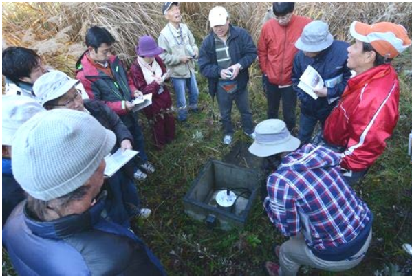
有珠山観測機器についての学習会の様子

これまでの講座は、有珠山周辺の観測機器について学ぶ現地学習会、プロガイドに話術や引率のコツについて学ぶ「ガイド技術講習」の他、噴火湾のイルカやシャチの生態についてオープンスペースでお話を聞ける会等がありました。