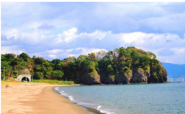
横からみると、海につきだした地形がよくわかります

「チャシ」とは、争いの時の砦と言われていますが、ここは海に突き出た地形なので、漁をする時の見張り台だったのではないかという説もあります。地球の活動と、人間の歴史の両方を感じられるジオサイトです。