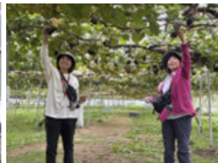
有珠山の恵みをめぐる(壮瞥町)