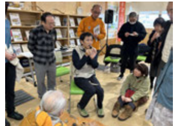
3/8 先史時代の黒曜石利用