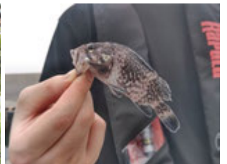
釣り+ジオパーク(洞爺湖町)