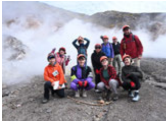
有珠山の恵みをめぐる(伊達市)