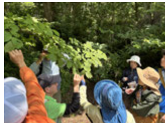
7/13 植物とアイヌ文化