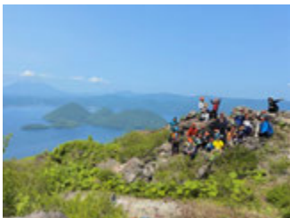
6/1 親子有珠山登山会