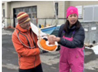
冬の AT ツアー(豊浦町)