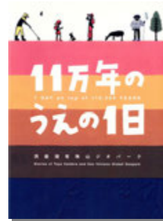
11 万年のうへの 1 日