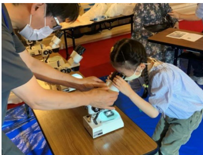
顕微鏡を初めて使う参加者も！