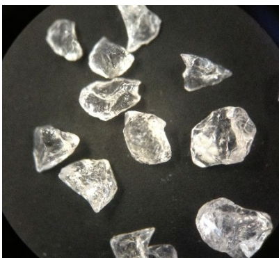
顕微鏡でみた石英の粒。