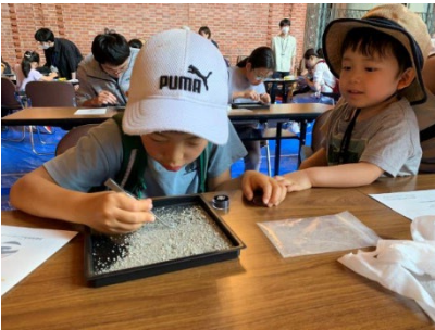
砂の中から石英を探します