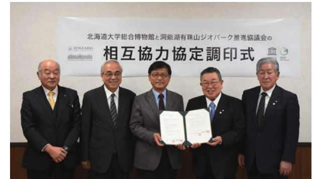
北海道大学総合博物館との相互協力協定

ジオパークの推進には、地域団体や関係機関との連携が欠かせません。特別な協力体制が必要な場合、連携のための協定書等を取り交わし、連携の強化を図ります。また、協議会の構成員、顧問、委員等に就任する場合、役割と期間が明記された書面を取り交わすことで、その役割を明確化します。