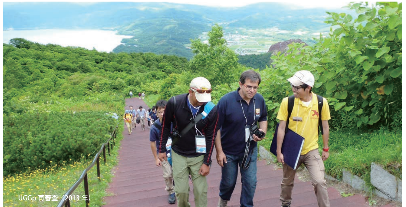
UGGp 再審査（2013 年）