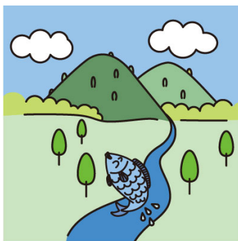
洞爺湖有珠山地域の自然

ジオパークの活動とは、大地の成り立ちから恵みまでをひとつの物語と捉え、地元の人から旅行者へ、あるいは次の世代の子どもたちへ、地域の魅力を伝えること。その主役はこの地域に住んでいる私たちです。