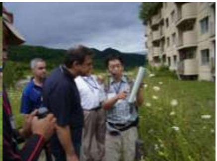
フットパス金比羅山コース