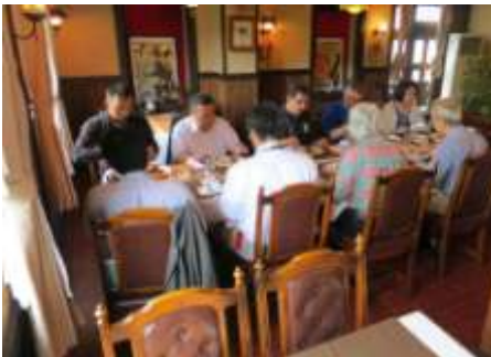
山中前会長との懇談昼食会