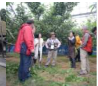
そうべつくだもの村