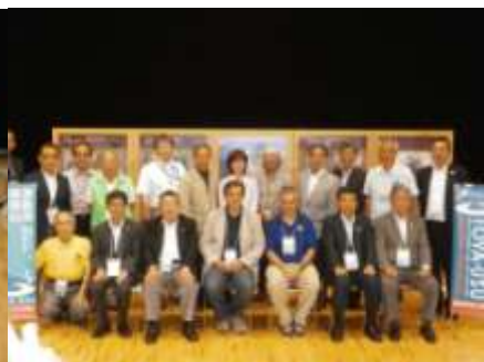
記念写真(講評終了後)