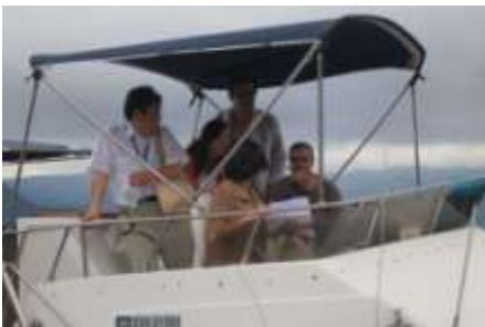
洞爺湖湖上めぐり