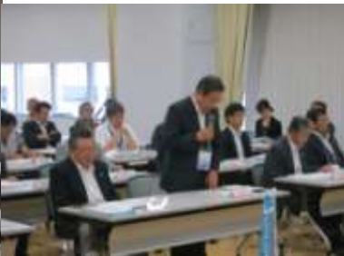
山谷副知事による挨拶