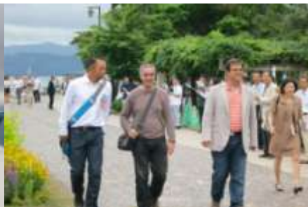
住民の歓迎を受ける審査員