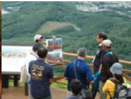
有珠山ロープウェー山頂駅