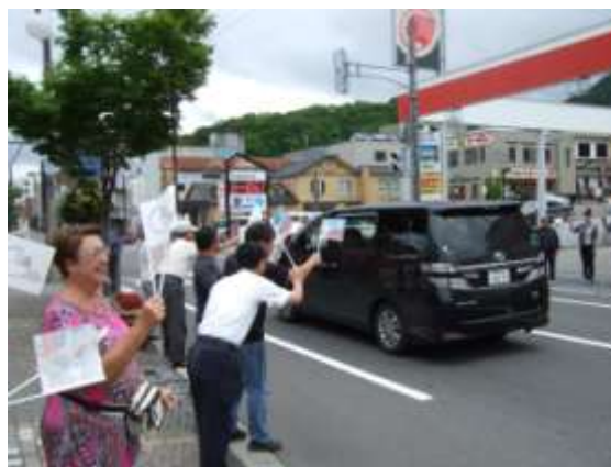
地域住民・ジオパーク関係者による見送り