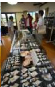
アルトリ海岸 ネイチャーハウス