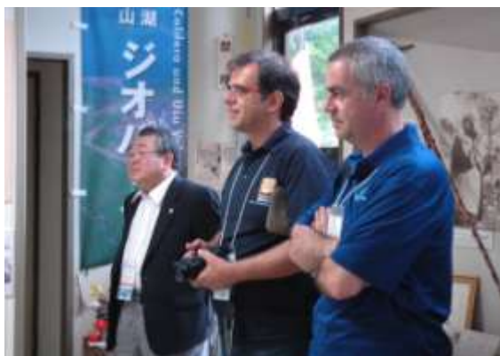
三松正夫記念館にて

現地審査終了後の講評においては、審査員のお2人から「洞爺湖有珠山火山マイスター制度等により地域の方々のジオパーク活動が広がっていること」「当ジオパークが防災教育における学びの場となっていること」「地場産品プロモーションの取組を積極的に進めていること」「北海道や各構成自治体等から質の高い支援を受けて活動を続けていること」などについて、高評価をいただきました。