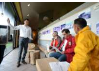
史跡北黄金貝塚公園