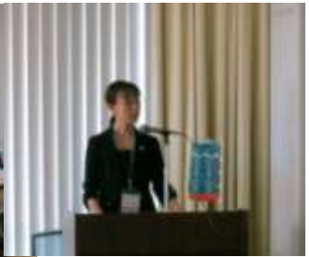
協議会プレゼンテーション