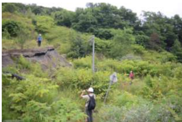
追加エクスカージョン 西山山麓